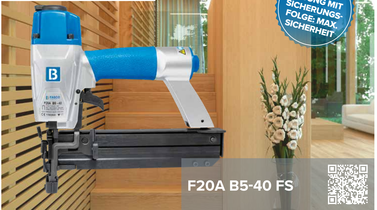
F20A B5-40 FS